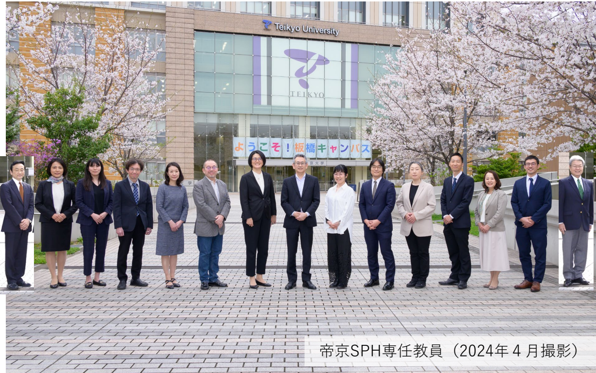
帝京SPH専任教員 (2024年4月撮影)